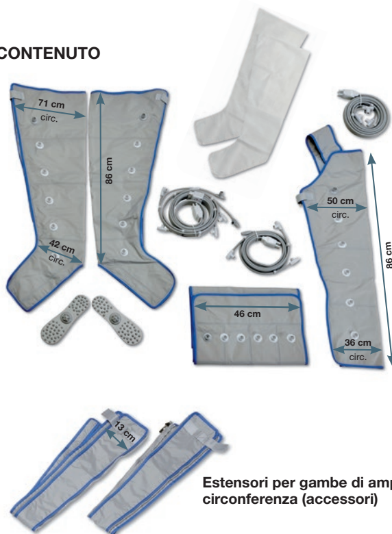
Estensori per gambe di ampia circonferenza (accessori)

Il presente documento e i suoi contenuti sono riservati esclusivamente a personale medico.