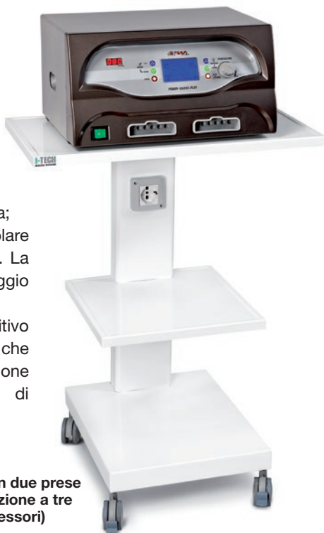
Carrello con due prese di alimentazione a tre ripiani (accessori)

POWER Q6000 Plus possiede 5 differenti modalità di gonfiaggio delle camere d'aria, 8 livelli di velocità del flusso d'aria all'interno delle camere e la possibilità di impostare il tempo e la pressione della terapia. In questo modo è possibile personalizzare ciascun trattamento in base alle esigenze terapeutiche del paziente.