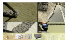
TUTTI I PANNELLI