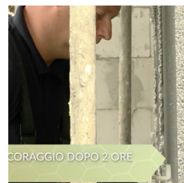
CORAGGIO DOPO 2 ORE