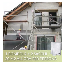
1 BOMBOLA = 2 SACCHI 20 M2 ALL'ORA PER PERSONA